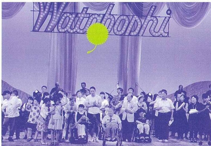
第43回わたぼうし音楽祭 フィナーレ

「オルス」は韓国・天安の発達障害のある若者たちが、舞台芸術活動を通して新たな可能性を探求している芸術集団です。レパトリーは、サムルノリ、仮面劇、創作劇、民謡など多岐にわたりますが、今回は韓国の伝統音楽から発祥した舞台芸術「サムルノリ」を紹介します。「オルス」の若者たち約20人によるエキサイティングな演奏は、日韓の友情の絆を固く結ぶとともに、魂のふれあう喜びを共感させてくれることでしょう。