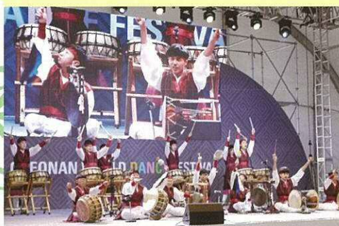
ゲスト／韓国・芸術集団「オルス」