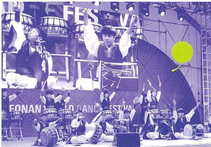
韓国・芸術集団「オルス」

障害のある人たちが書く詩は、生きることの喜びや哀しみ、いのちの尊さや人間の素晴らしさを歌っています。そこには人間として大切なものを見失いがちな、今の社会へのメッセージがあふれています。こうした思いをメロディーにのせて歌い、いのちにやさしい社会をつくろうと、1976年に日本のふるさと奈良で「わたぼうし音楽祭」が生まれ、以来44年、皆さんのやさしさに支えられ、歌い継がれ、深い感動と共感を呼び覚ましてきました。2019年8月、私たちは「第44回わたぼうし音楽祭」を通して、明日に笑顔と希望を届けます。